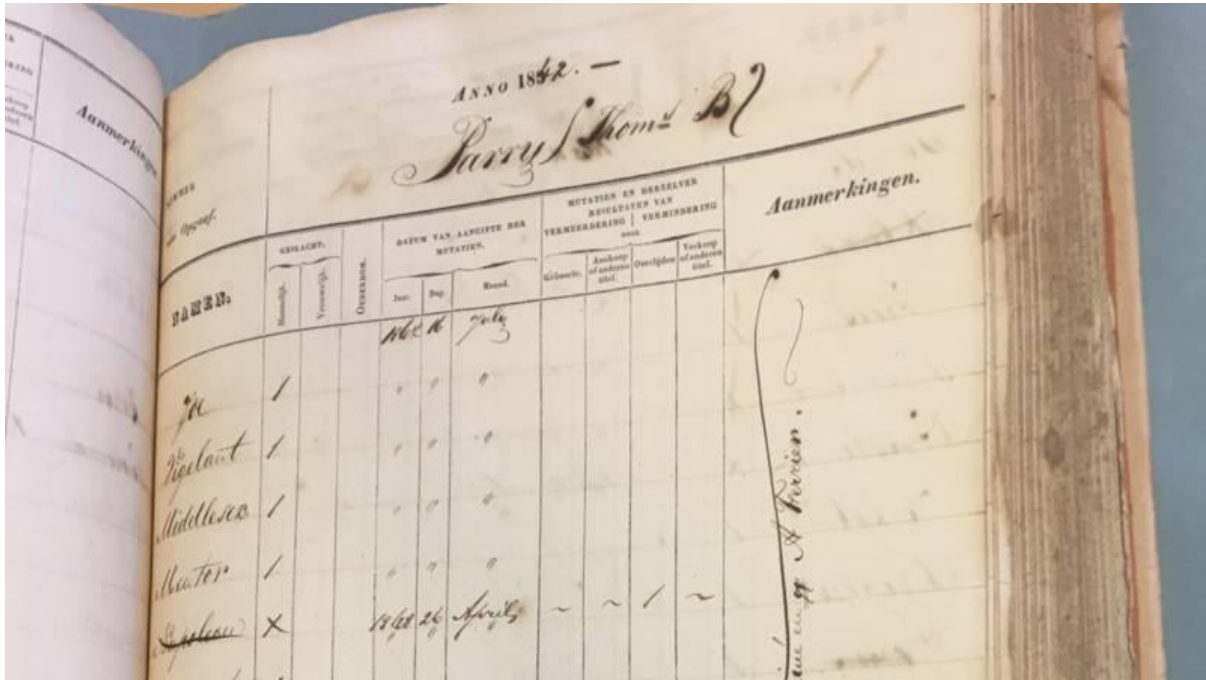
Slavenregister 1842 NOS